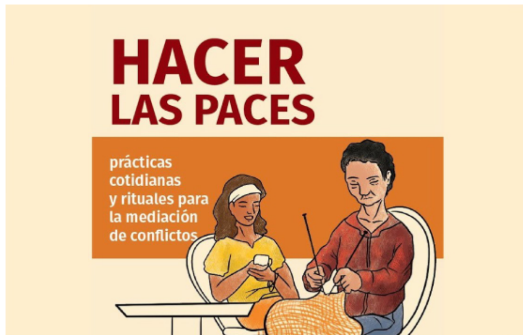
Figura 7. Herramienta pedagógica Hacer la paces creada en el marco del proyecto Sanaduría en alianza con el programa La paz se toma la palabra del Banco de la República. 2023.

Una vez terminada la exposición, Sanaduría se ha concentrado en la creación de redes con otros colectivos y académicos que profundizan el potencial político de nuevas formas de producción de conocimientos, reconociendo los mundos oníricos, la mitología, la poética y el potencial artístico cuando se trata de pluralizar la paz, imaginando futuros alternativos.