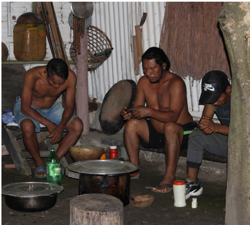
Figura 1. Conversaciones en torno a la paz en el mambeadero.