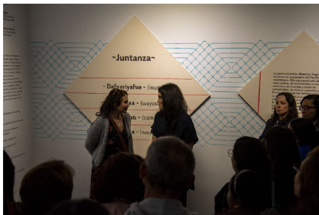
Figura 3. Visita guiada de la exposición a cargo de las curadoras.

Abrir caminos. Noción nasa que invita a la apertura y a la afectación multisensorial, profundizando en conocimientos y prácticas en las que intervienen plantas como la coca. Es la convicción de que existen formas de transformación para la convivencia, incluso en las situaciones más aciagas y difíciles. Es emprender las tareas que permitan despejar el horizonte de los obstáculos que impiden el diálogo, el reconocimiento y la inclusión del otro.