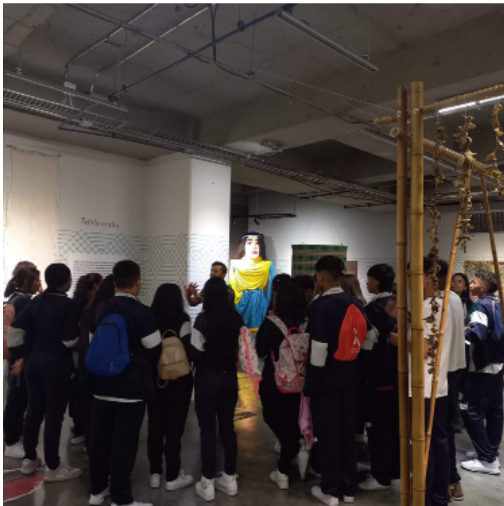
Figura 6. Mediaciones en el espacio expositivo. Foto: Equipo Sanaduría, 2023.

Reflexiones que nos llevaron a comprender la paz como noción plural, más que como un estado ideal que se alcanza después de la práctica de la guerra, pues el ejercicio de la paz sucede incluso en medio de la guerra. Evidenciar esas contradicciones y tensiones en torno a la paz, nos permitió valorar las posibilidades transformativas que las personas y las comunidades pueden movilizar en diversos territorios.